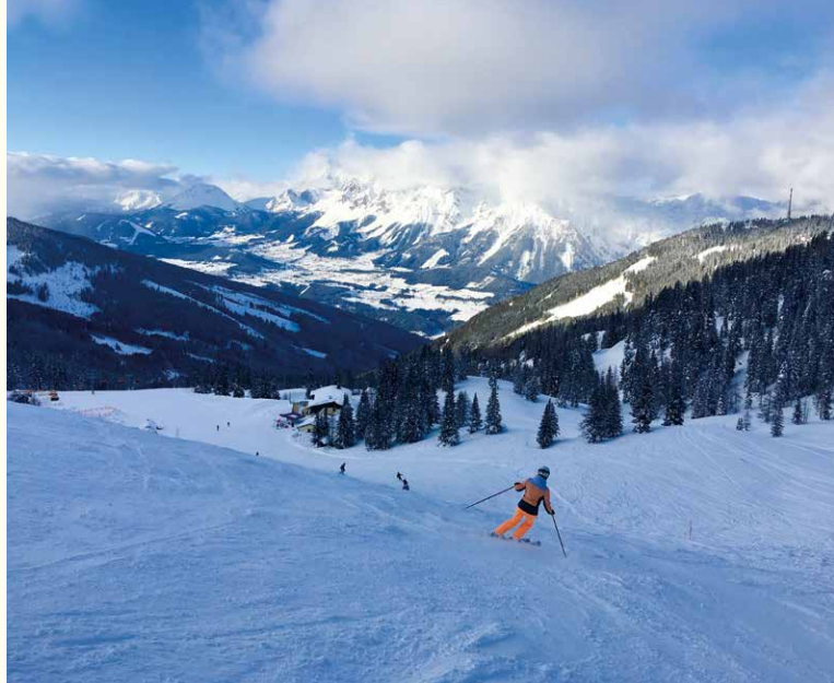
Gut präparierte Pisten auf dem Hauser Kaibling mit herrlichem Blick auf den Schladminger Hausberg Planai.

Weitere Infos GDL Magazin VORAUS 10/2019 www.gdl.de/Jugend www.facebook.com/skimeisterschaft E-Mail: skimeisterschaft@gdl-jugend.de Mobil: Andreas Uhlig (01 52) 55 98 05 28