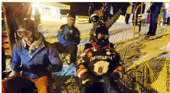
Rasant geht es runter: auf der sieben Kilometer langen Naturrodelbahn von der Hochwurzen nach Schladming.

Hinzu kommt das attraktive Rahmenprogramm der GDL-Jugend. Geplant ist unter anderem wieder der Rodelabend. Nach einem